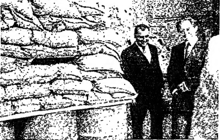
السفير امام مئراس رمي عند مدخل السفارة

لمناسبة العيد الوطني الفرنسي في الرابع عشر من تموز اقامت السفارة الفرنسية في لبنان احتفالا عسكريا في باحة قصر الصنوبر الحادية عشرة من قبل ظهر امس حضره السفير الفرنسي السيد كريستيان غريف واركنا السفارة وعدد من الضباط الفرنسيين والشخصيات اللبنانية.